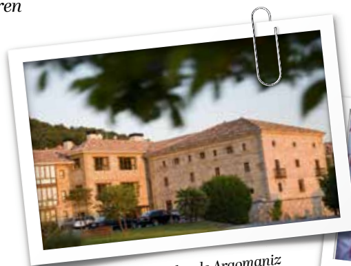
Parador de Argomaniz